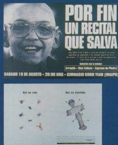
Em cima, anúncio pelas vítimas de leucemia: forte. Em baixo, a ilustração didatiza o problema; a solução fica no texto. Ao lado, jogo de palavras com a expressão "gancho", para vender edredons.