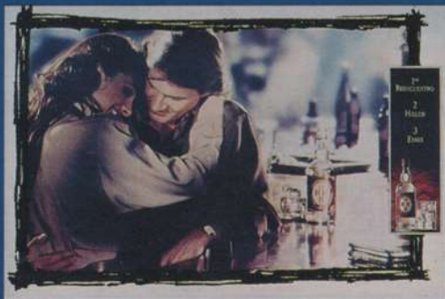
Anúncio clássico de bebida, associando bom gosto com a marca.