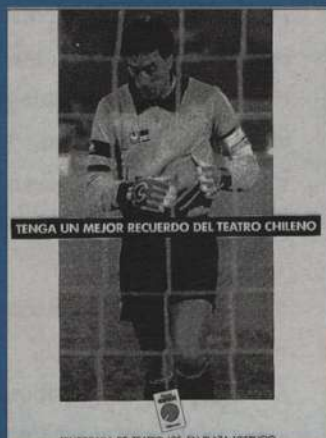
Ótima peça para a temporada de teatro chileno: não à palhacada de Rojas.