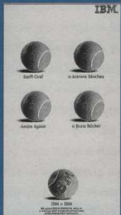
Raciocínio comparativo para vender o patrocínio da IBM.