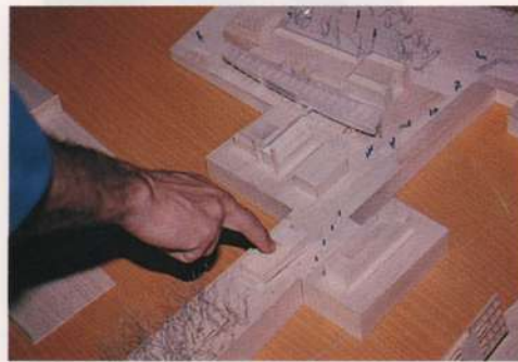
Maquete do projeto para o Museu do Prado.

formatar sua participação comercial no mercado, vêm trazendo bons resultados e interesse do mercado catalão. Entre as atividades desenvolvidas neste primeiro ano, de forma conjunta e multidisciplinar ou autônoma pelas distintas áreas, estão o Concurso Internacional para a ampliação e remodelação do Museu do Prado (Madrid); Concurso-proposta de ecocidade "Bucarest 2000"/UNESCO e Unión Internacional de Arquitectos; Projetos de Informática, Internet e Intranet para Camel Motor Club, Nike, J. Reynolds, Adams,