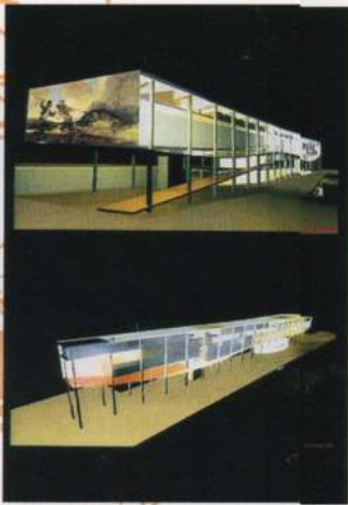
Projeto multidisciplinar para ampliação e remodelação do Museu do Prado (Madrid).

E nquanto as discussões empresariais giram em torno do downsizing, da reengenharia, da terceirização, levando ao aumento do desemprego e à sobrecarga dos que se mantêm empregados, há gente séria pensando em melhorar a qualidade de trabalho da humanidade. As grandes multinacionais, principalmente nos Estados Unidos, instituíram o "casual day", ou seja, sexta-feira liberada de terno e gravata. Intelectuais