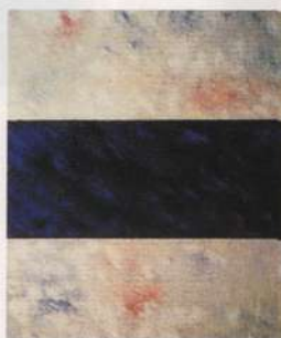
Palabras sobre la palabra.