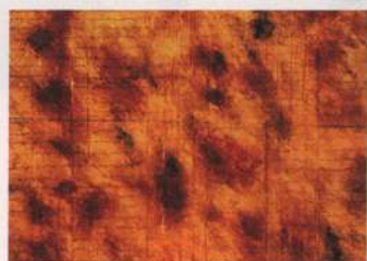
"Textos & Pretextos"

japoneses protestam pela robotização e exploração da massa de trabalhadores do país. Algumas empresas abrem seus espaços de trabalho, exigindo maior integração e generalismo de seu pessoal. Sente-se a necessidade de humanizar as relações de trabalho, trazendo mais prazer ao "horário comercial". Um grupo de jovens e bem-sucedidos profissionais de várias nacionalidades