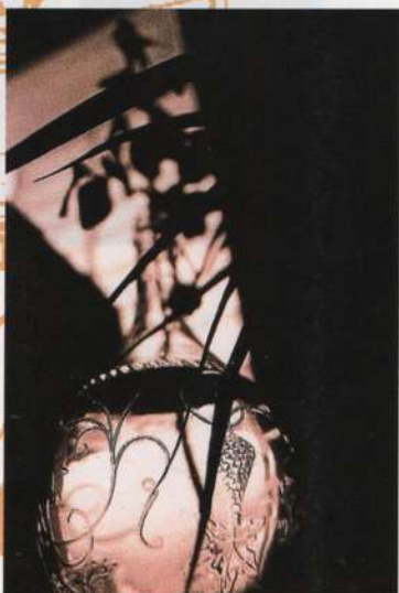
Imagem do arquivo pessoal do fotógrafo Juan Argelés Cugat, desde o começo de 1996 com estúdio no espaço Kubik. Especializado em arquitetura.

Fotografia, Informática, Design Gráfico e Pintura. A ousadia e a bem-vinda vanguarda, por tentarem novas maneiras de