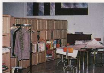
Soluções inteligentes e econômicas para a decoração de espaços multidisciplinares.