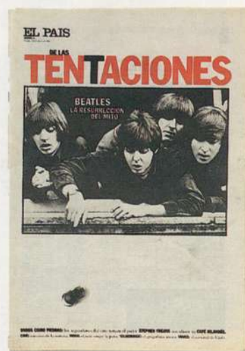
A vigorosa mão de Gutiérrez em duas publicações: Revista "Matador" e o encarte "El País de las Tentaciones"

FG — Claro, se não conseguirmos ler, não funciona.