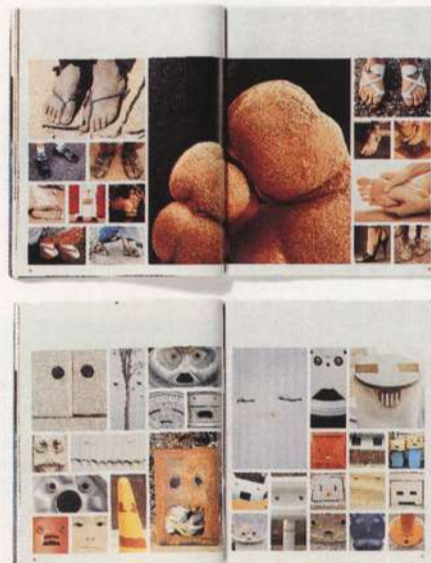
Revista "Colors", da Benetton. Sem palavras

FG — É uma revista produzida como uma peça de arte, com tiragem de apenas três mil exemplares (vendidos a US$ 40 cada), feita não por jornalistas, mas pelos próprios protagonistas do mundo das artes. Foi lançada em 1995 e será publicada uma vez por ano até