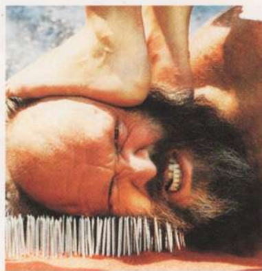
Imagem do convite do Andy Awards

Agora você pode faturar US$ 50 mil em cash pela criatividade de suas peças publicitárias. É o que prometem os organizadores do Andy Awards e o Advertising Club of New York. As inscrições terminam neste final de novembro, e ainda há tempo para garantir presença na cerimônia de premiação, em meados de abril do ano que vem. São cinco as categorias em disputa: mídia interativa, TV/vídeo/cine, rádio, gráfica e material promocional, mas o Grandy pecuniário vai apenas