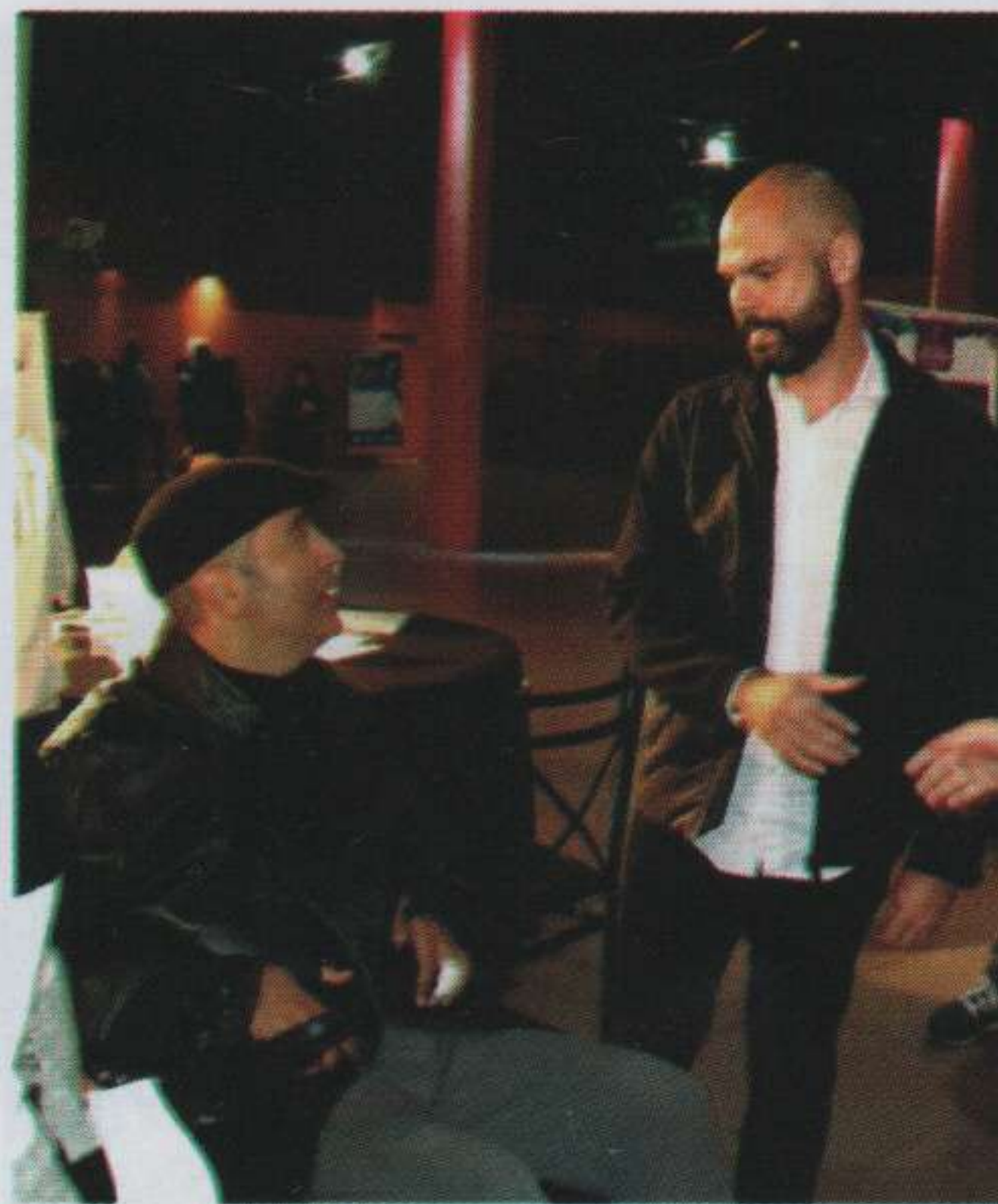
Com o prefeito Bruno Covas e o presidente Michel Temer

A gente vive uma vez só e precisa tirar o máximo disso. Digo a todas as pessoas e não só àquelas com deficiência, que precisamos ter uma vida mais plena e interessante possível, com bom relacionamento familiar, capacitação e contribuindo com a sociedade financeiramente e em questões sociais e de inclusão. Não consigo entender quem não tem esse drive de viver, porque tento sempre tirar o máximo da vida.