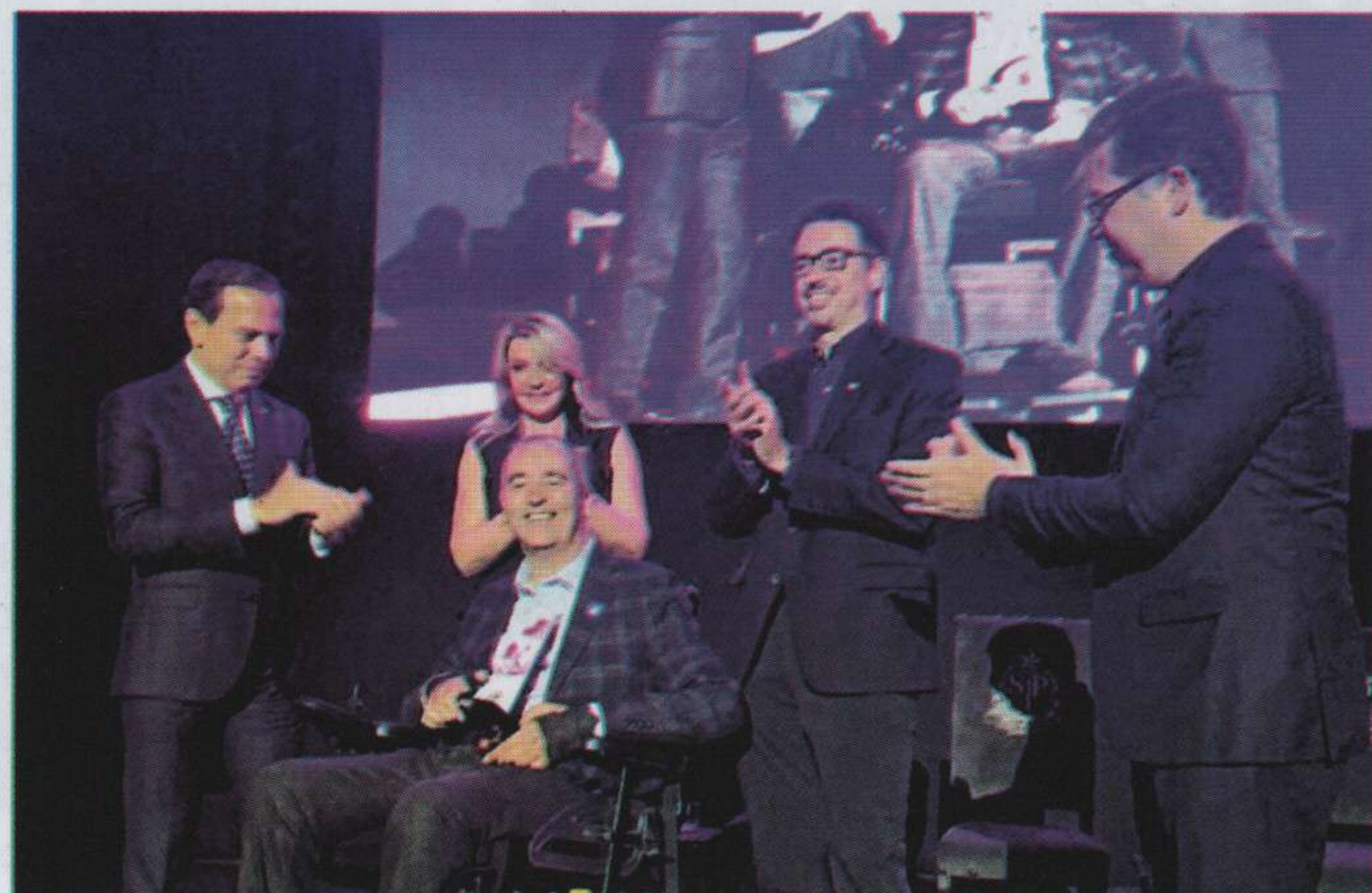
Prêmio Governo do Estado de São Paulo para as Artes, categoria Inclusão, com o governador de São Paulo, João Doria