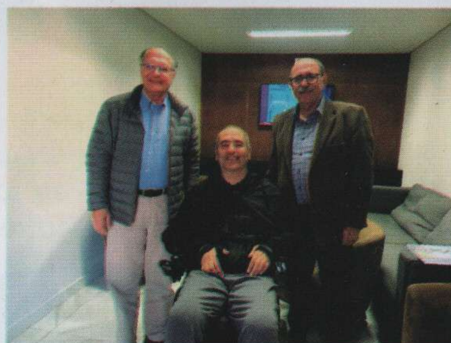
Com o governador de São Paulo, Geraldo Alckmin, e com amigos no seu Bar do Bretagne, em Higienópolis