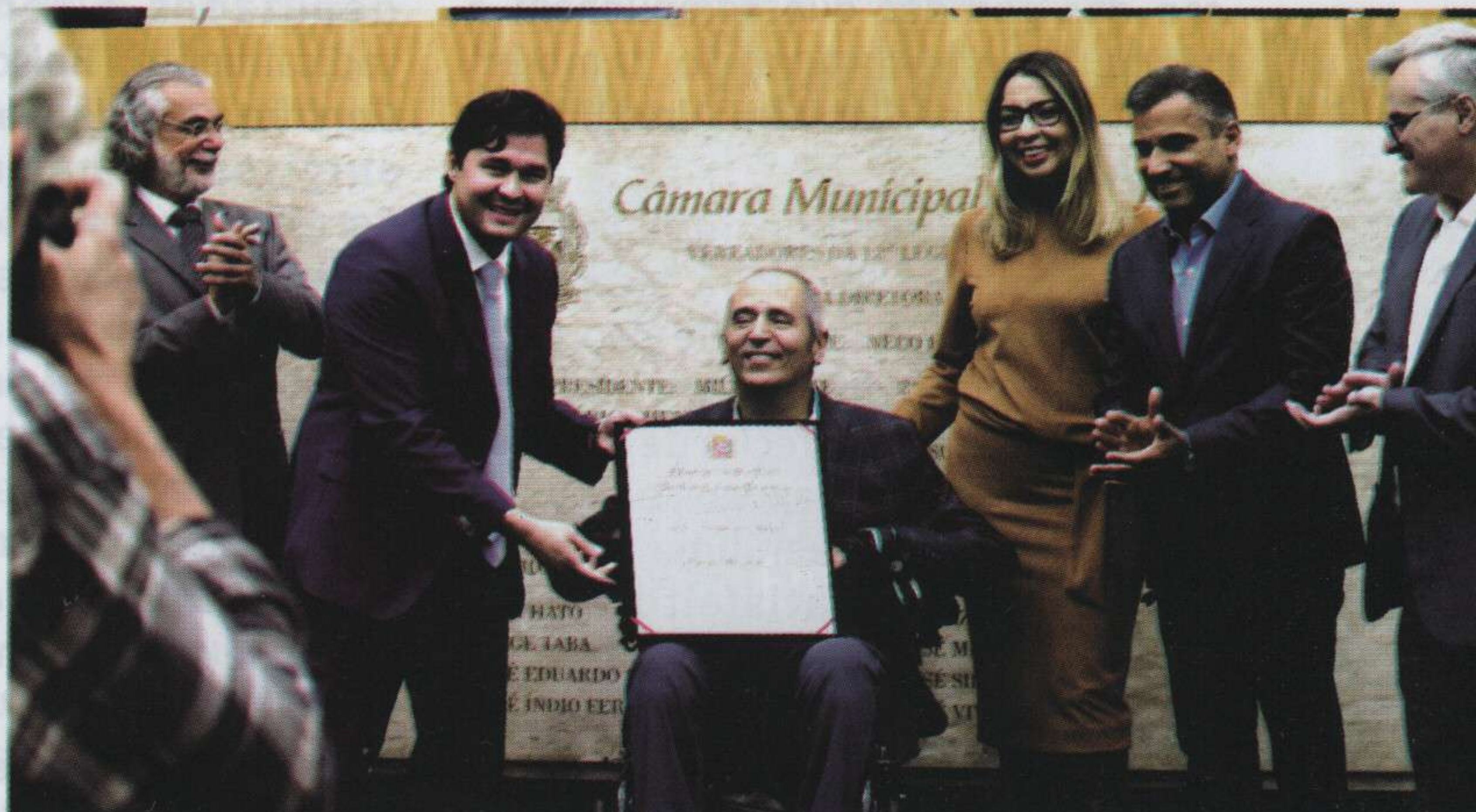
Recebendo o Título de Cidadão Paulistano na Câmara Municipal de SP