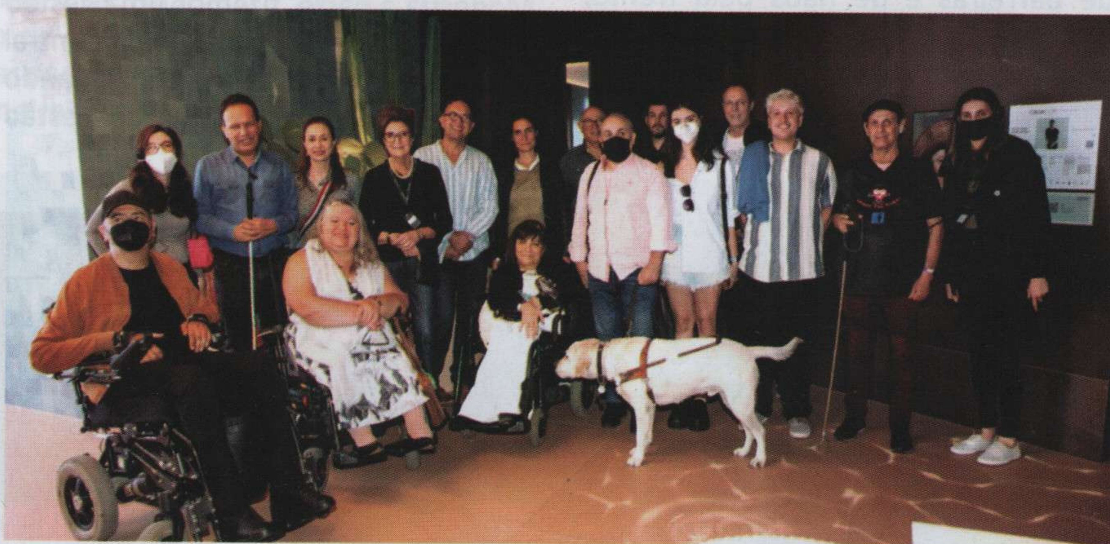
Visita à Casa Cor São Paulo para pessoas com deficiência