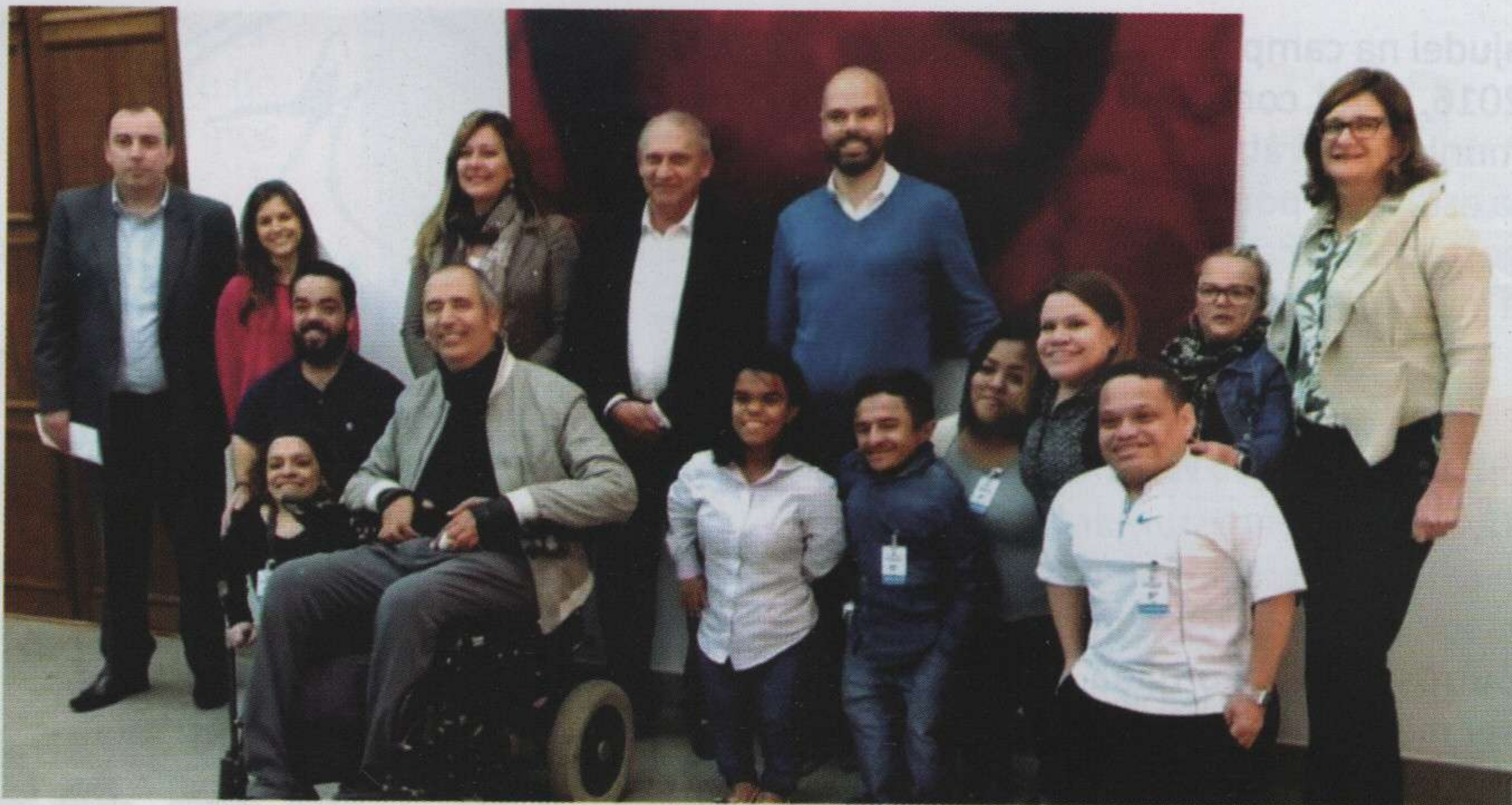
Reunião com fundadores da Associação de Nanismo Brasil, com o prefeito Bruno Covas